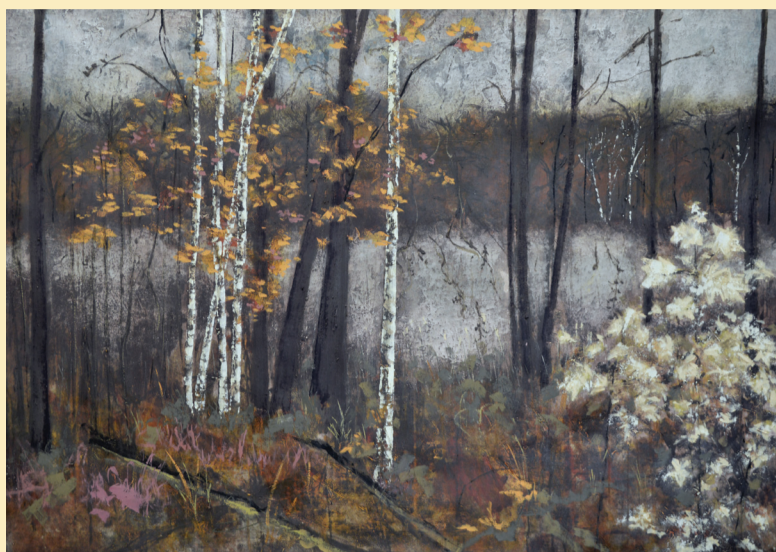
"Tidsånden i landskabet" I, 90 x 130 cm. 2015. Akryl på lærred.