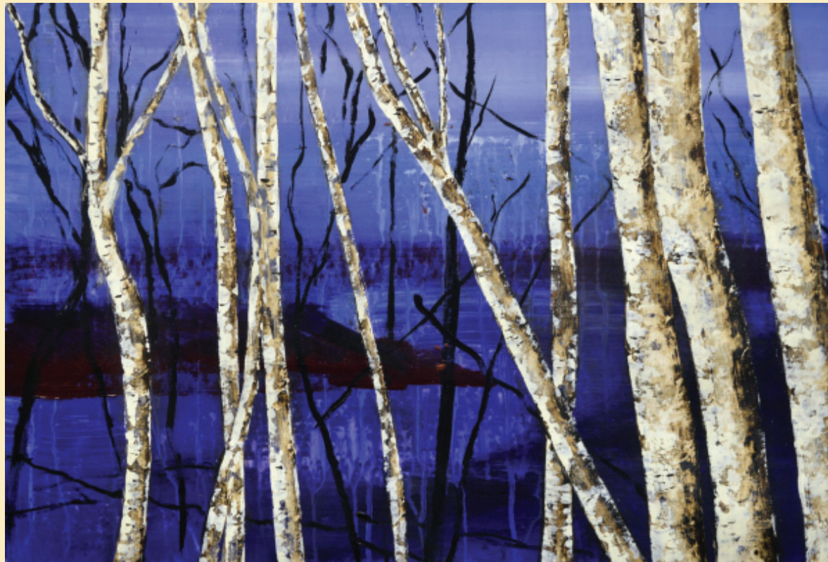
"Landskabet bagved" II, 40 x 60 cm. 2015. Akryl på lærred.