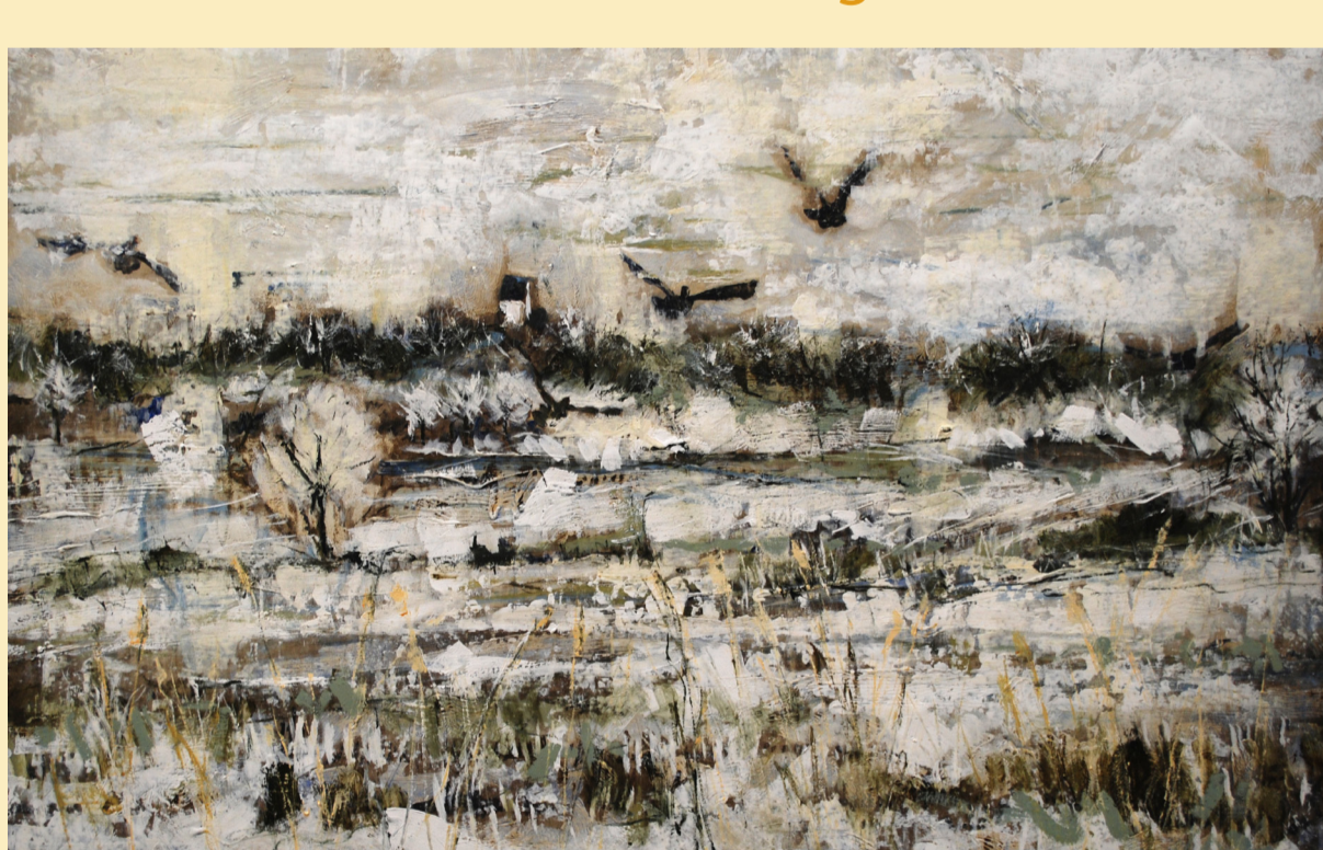
"Frostvejr" IV, 80 x 130 cm. 2011. Akryl på lærred

Derude i himlen høres stemmer om vår, de blander sig med vintervind og rester af sne, mens kysten knækker bølger i millioner af år. Nattrækker fugle, og marts viol Isblomster smelter under den sorte sol - i marsken