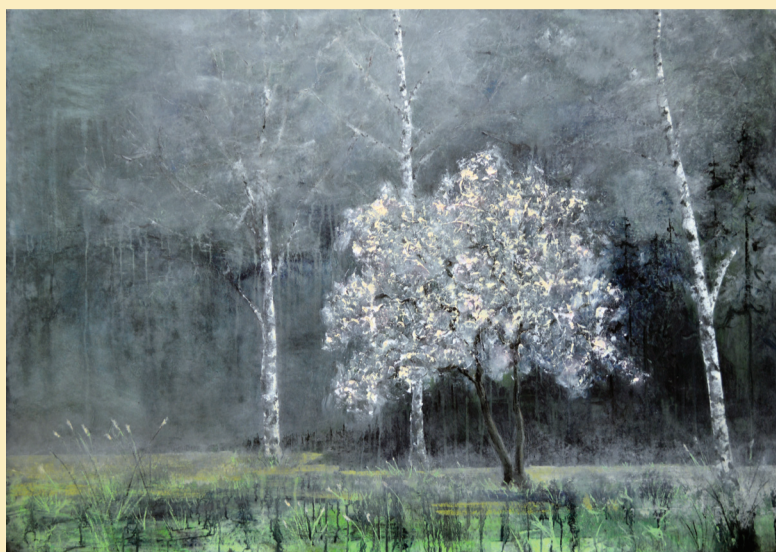
"Ensomt blomstrende æbletræ i morgendis" 90 x 130 cm. 2015. Akryl på lærred